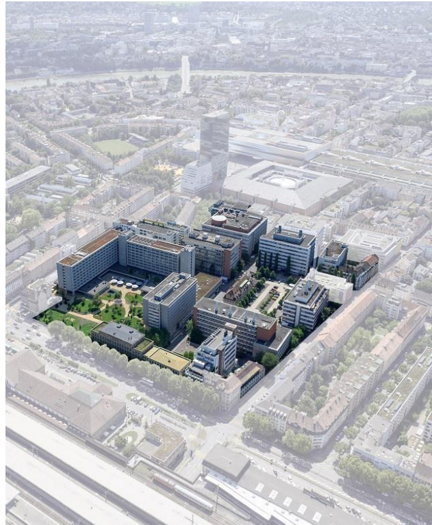
Luftaufnahme Rosental Mitte