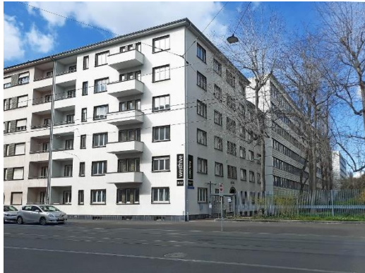
Westhive Rosental Mitte Basel aussen

Alle Bilder haben Sie auch als separate Bilddateien erhalten.