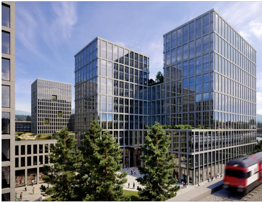
Westhive Genf Pont-Rouge eröffnet 2023

Alle Bilder haben Sie auch als separate Bilddateien erhalten.